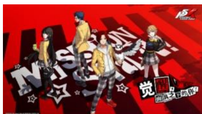
女神异闻录：夜幕魅影