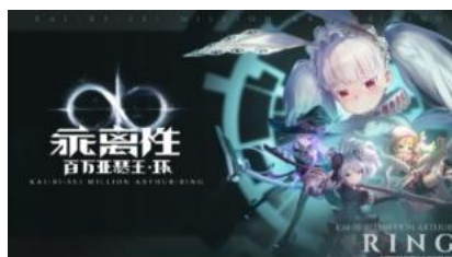
乖离性百万亚瑟王：环