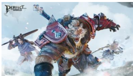
Perfect New World